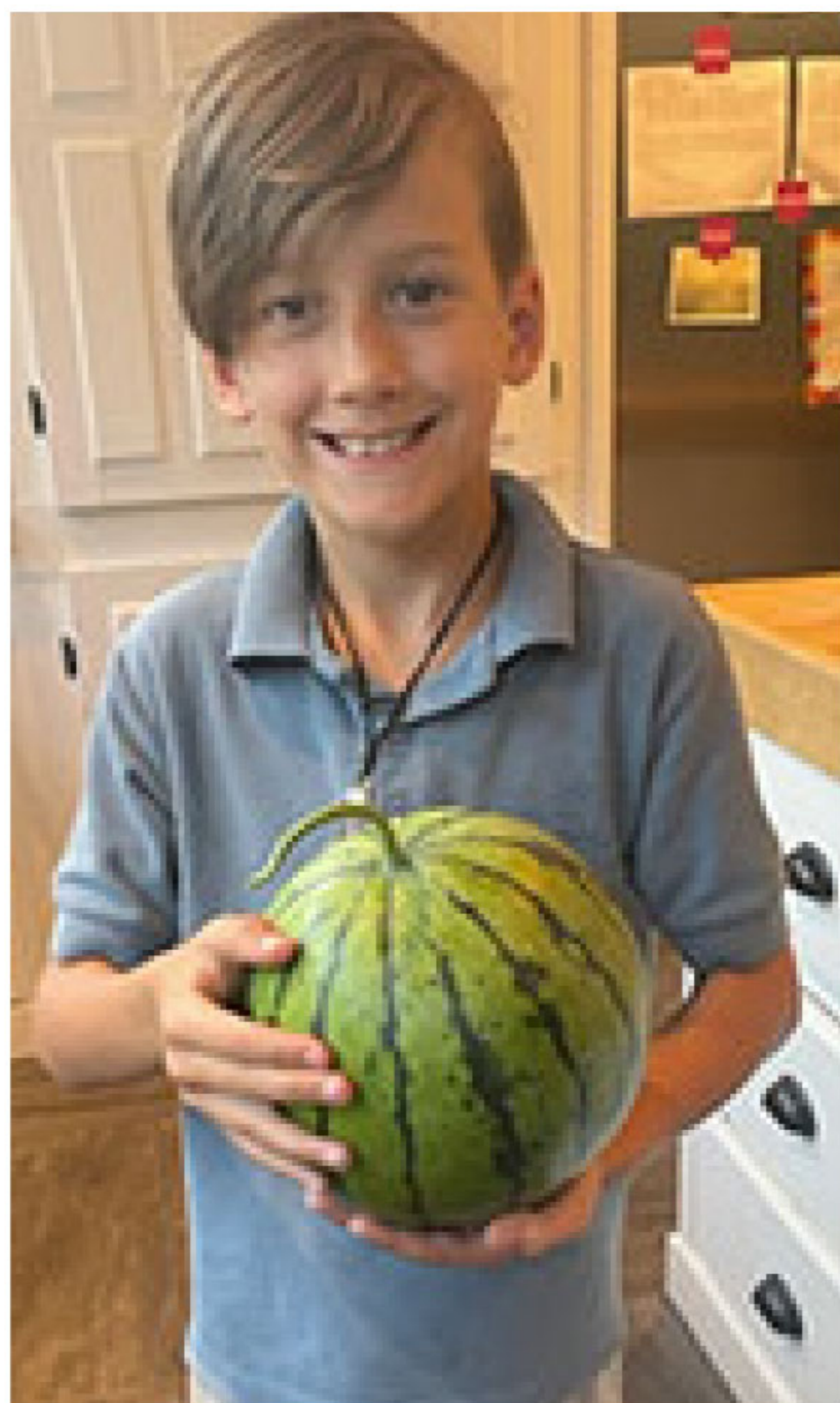
ME-06 Melon d'eau Cream of Saskatchewan

TO-51 Mauve: même caractéristique que TO-50 mais à fruit mauve. Sachet (±150gr.) 3.00$